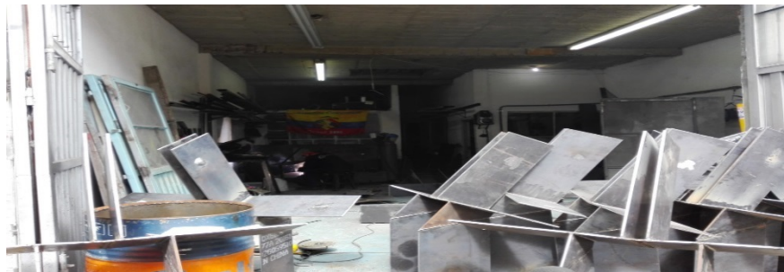
Fotografía No. 3 Vista al interior del predio de interés