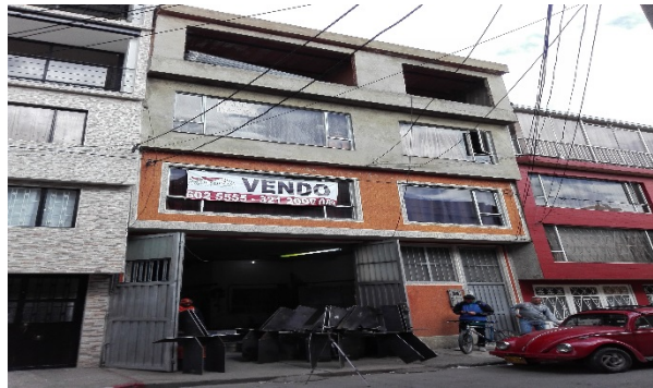
Fotografía No. 1 Registro vista frontal del predio ubicado en la Carrera 108 A No. 68 B - 38